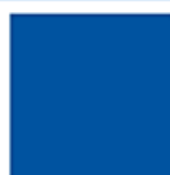
Pantone Reflex Blue