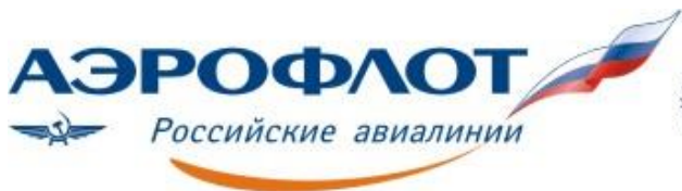
Логотип ПАО «Аэрофлот»