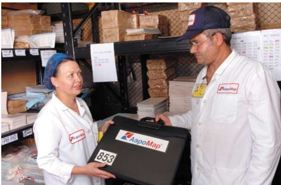
Сотрудники отдела учета движения бортовой посуды

В процессе использования происходит отбраковка неисправного, битого и сломанного оборудования. Буфетно-кухонное оборудование, подлежащее ремонту, направляется для ремонта, не подлежащее – списывается в соответствии с установленными процедурами с участием представителей ОАО «Аэрофлот».