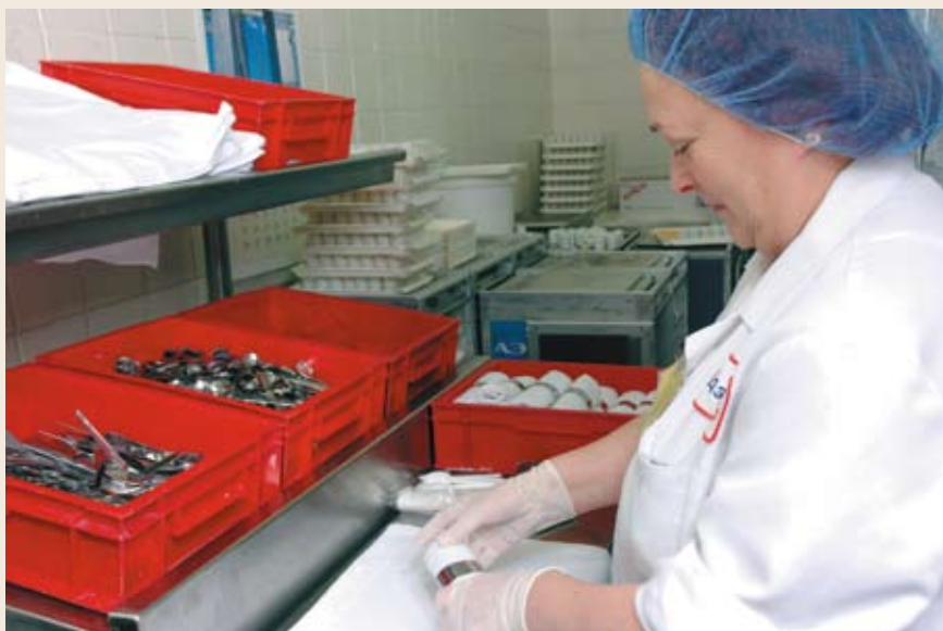
Сотрудник цеха мойки и комплектации посуды за работой